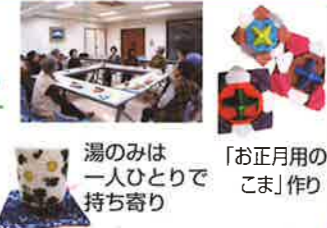
湯のみは一人ひとり持ち寄り

「何かあった時にはポプりで助け合うさ」の一言に、10年来のつきあいの深さを感じます。