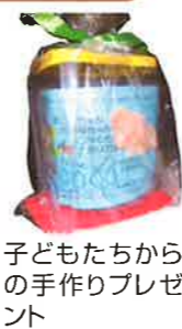
子どもたちからの手作りプレゼント