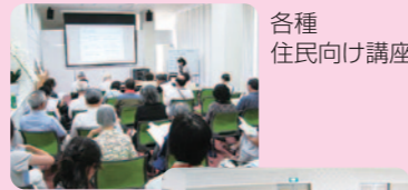
各種住民向け講座

区内を4ブロック(しもまち・上新潟島・江東・みなみ)にした地域社協連絡会を柱にして、各地域で挙げられる課題・問題点を具体的に解決していくための研修・講座を開催し、地域福祉活動を推進します。