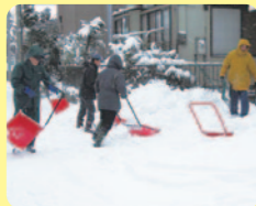
雪かきボランティア

「ひとり暮らし高齢者の生活と意識の調査」結果に基づき、新たな高齢者の見守りや生活支援、地域交流を推進するとともに、いつでも気軽に相談できる総合的な福祉の相談体制の整備を行います。