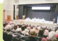
社会的孤立を防ぐ取り組みを考えるシンポジウム

地域住民や各種団体(企業)の参画による区社協運営を行い、会員意識の醸成に努めます。また、中央区社会福祉協議会の中期計画と位置付けている、地域福祉活動計画(オアシスプラン)の検証と、今後の事業や組織・財政についての方針を定めます。