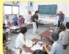
ふれあい・いきいきサロン