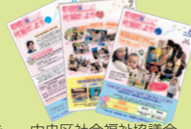
中央区社会福祉協議会 広報誌(年4回)